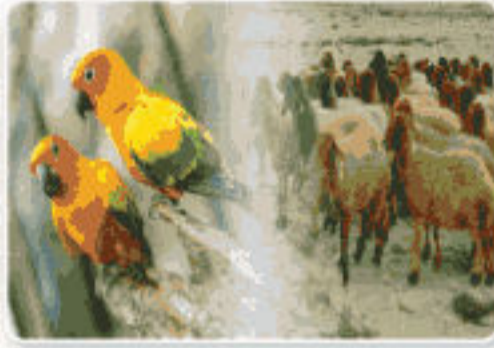
الغنم - الطيور