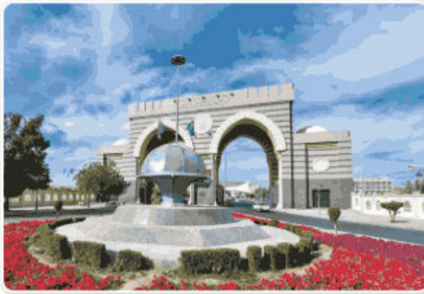
الجامعة الإسلامية بالمدينة المنورة

ولهذا وجدت العلوم الشرعية الاهتمام والعناية منذ بعثة نبينا محمد ﷺ، وحثه على تعليم أبناء المسلمين القرآن الكريم والأحكام الشرعية، وتوالى هذا الاهتمام في عهد الخلفاء الراشدين ومن بعدهم حتى تأسست المملكة العربية السعودية في تاريخها الحديث على يد الملك